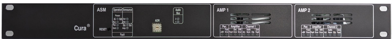
Frontansicht CuraG3 Erweiterungsgerät

Das Erweiterungsgerät mit 2 x 250 W Verstärkern ergänzt eine IP-Beschallungsanlage der Produktfamilie Cura® in der 3. Generation um weitere Leistungsverstärker und Ausgangslinien. Eine Beschallungsanlage der 3. Generation kann aus bis zu 20 Geräten bestehen, die im Verbund arbeiten und durch das Grundgerät gesteuert und überwacht werden.